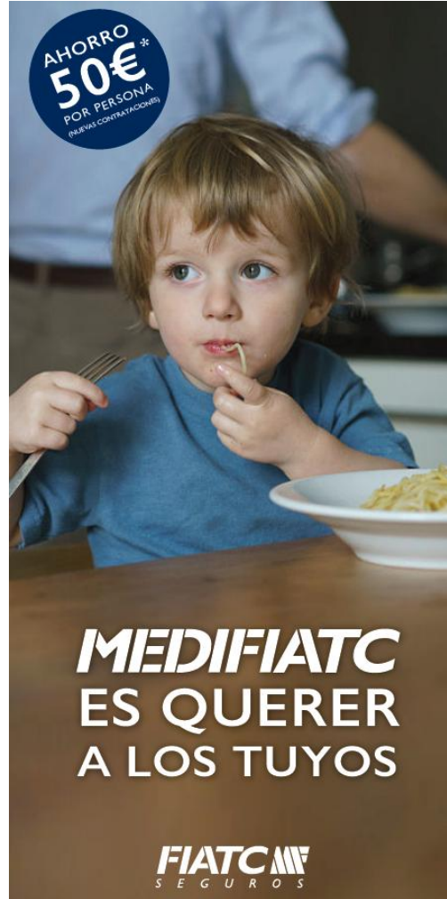
Imagen Flyer de Campaña (La creatividad se adaptará al resto de formatos)